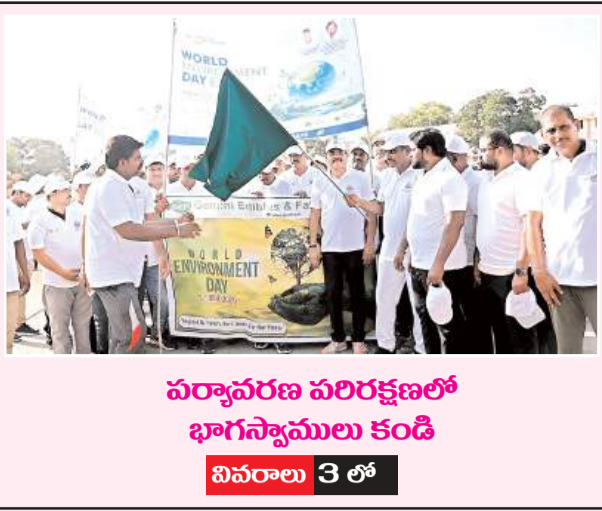
పర్యావరణ పరిరక్షణలో భాగస్వాములు కండి వివరాలు 3 లో

విలేకరులు కావలెను సింధూరదర్శిని జాతీయ తెలుగు దినపత్రికలో జల్లా వారీగా పనిచేయుటకు జల్లా ఇన్స్ట్రల్లు మరియు మండలాల వారీగా పనిచేయుటకు విలేకరులు కావలెను. ఎలాంటి వేతనం ఇవ్వబడదు. యాడ్స్ పై ఆకర్షణీయమైన కమిషన్ ఇవ్వబడును. అనుభవం ఉన్న వారికి ప్రాధాన్యత ఇవ్వబడును. వివరాల కొరకు బయోడేటాతో క్రింది నంబర్ను సంప్రదించండి. సెల్ నెంబర్ : 7569677170