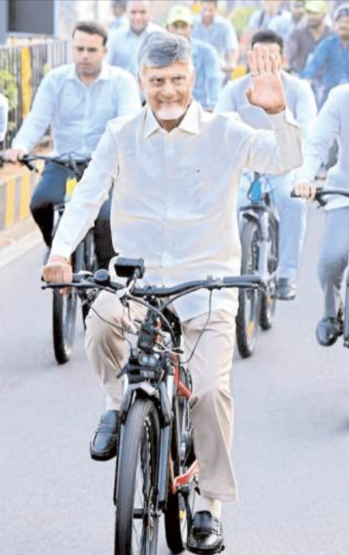
విశాఖపట్నం, సింధూరదర్శిని: రాష్ట్రంలో ఆక్వా రంగం అభివృద్ధికి అవసరమైన ఎకో సిస్టం ఏర్పాటుచేసేందుకు సిద్ధంగా ఉన్నామని ముఖ్య మంత్రి నారా చంద్రబాబు నాయుడు అన్నారు.