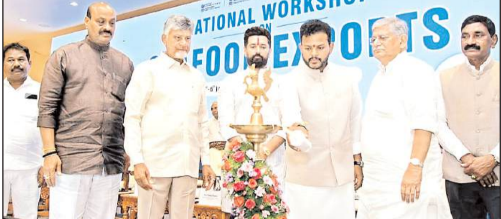
ఆక్వా రంగానికి భారతదేశం లైట్ హౌస్ అంటే. కృష్ణపట్నం, నెల్లూరు ప్రాంతాలను కలుపుతూ ఆక్వా దానికి ఏపీని కేంద్ర బిందువు చేస్తామన్నారు. కారిడార్ అభివృద్ధి చేస్తామని సీఎం ప్రకటించారు. అమరావతి, భీమవరం, కాకినాడ, విశాఖపట్నం, ఈ కారిడార్ ఆక్వా అభివృద్ధికి మగతా 2లో...