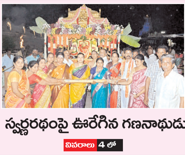
స్వర్ణరథంపై ఊరేగిన గణనాథుడు వివరాలు 4 లో

విలేకరులు కావలెను సింధూరదర్శిని జాతీయ తెలుగు దినపత్రికలో జిల్లాల వారీగా పనిచేయుటకు జిల్లా ఇన్స్పెక్టరుల మలయు మండలాల వారీగా పనిచేయుటకు విలేకరులు కావలెను. ఎలాంటి వేతనం ఇవ్వబడదు. యాడ్స్ పై ఆకర్షణీయమైన కమిషన్ ఇవ్వబడును. అనుభవం ఉన్న వారికి ప్రాధాన్యత ఇవ్వబడును. వివరాల కొరకు బయోడేటాతో క్రింది నంబర్ ను సంప్రదించండి. సెల్ నెంబర్ : 7569677170