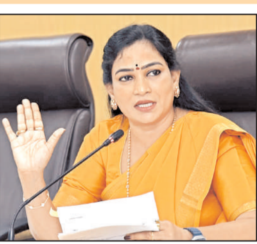
ఇప్పుడు దాదాపు 8, 9 నెలల తరువాత రాష్ట్రంలోనే చేయడం హాస్యాస్పదంగా ఉందన్నారు. ముఖ్యమంత్రి చంద్రబాబు ఎన్నో డిఎస్సీలు

అమరావతి, సింధూరదర్శిని: డిఎస్సీ 2025ను ప్రభుత్వం అత్యంత పారదర్శకంగా నిర్వహించిందిని రాష్ట్ర హోం శాఖామంత్రులు బంగలపూడి అనిత అన్నారు. ఏపీ సచివాలయంలో మంత్రి మాట్లాడుతూ కూటమి ప్రభుత్వం చిత్తశుద్ధితో ప్రజలకు జవాబుదారీగా పని చేస్తుందని తెలిపారు. గత ప్రభుత్వం కనీసం ఒక్క డిఎస్సీ ని కూడా నిర్వహించ లేకపోయిందని ఎన్నికలకు 60 రోజుల ముందు డిఎస్సీ నోటిఫికేషన్ కేవలం 6100 పోస్ట్ లతో వేశారని ఈ సందర్భంగా మంత్రి గుర్తుచేశారు. కాని మంత్రి లోకేష్ ఆధ్వర్యంలో మోగా డిఎస్సీ నిర్వహించారని తెలిపారు. 8 సంవత్సరాల నిరీక్షణ అనంతరం కూటమి ప్రభుత్వం మోగా డిఎస్సీని అత్యంత పారదర్శకంగా నిర్వహిస్తే